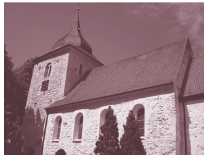
St.-Petri-Kirche in Bosau

Die Reisekosten für die Fahrt betragen bei Übernachtung im Doppelzimmer mit Frühstück 590 Euro und im Einzelzimmer mit Frühstück 860 Euro. Im Preis enthalten sind die Hin- und Rückfahrt mit der Bahn.